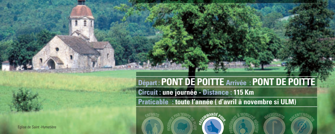
Eglise de Saint-Hymetière

Départ : PONT DE POITTE Arrivée : PONT DE POITTE